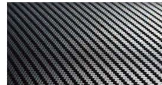
3M™ Scotchprint® Wrap Film 1080-CF12 カーボンファイバーブラック