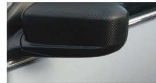
3M™ Scotchprint® Wrap Film 1080-CF12 カーボンファイバーブラック