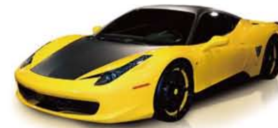
3M™ Scotchprint® Wrap Film 1080-M12 マットブラック